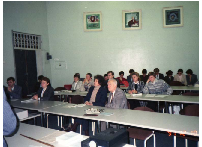
Выступление докладчиков в ходе проведения первой научно-технической Конференции

По результатам первого опыта проведения встречи, в ходе которой было рассказано об оригинальных и интересных самостоятельно выполненных научно-исследовательских проектах, выявлено, что организация подобных встреч в таком формате способна помочь молодому поколению исследователей приобрести навыки участия в публичных мероприятиях, выполнить обмен идеями и опытом, соотнести уровень собственных разработок с работами других участников. Именно в этот момент начался рост популяризации Конференции, которая впоследствии изменила статус всероссийской на международную.