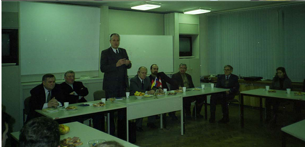
Вступительная речь организаторов на открытии второй научно-технической Конференции