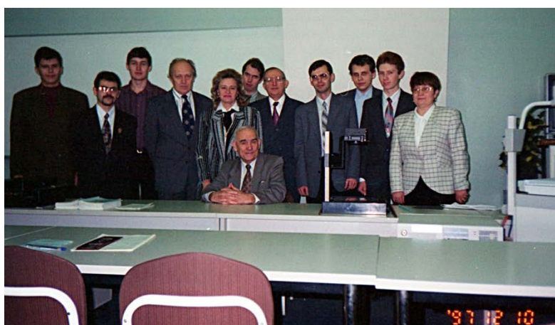
Памятный снимок организаторов Конференции

Своё летоисчисление научные встречи начинают с декабря 1997 года, когда ответственным коллективом была организована первая Конференция в стенах главного корпуса МГТУ им. Н.Э. Баумана.